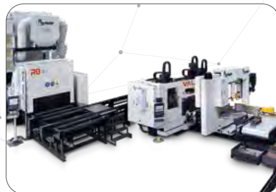
Layout du système automatique

Les scies à ruban Katana peuvent être équipées de notre unité de commande numérique Pegaso pour gérer automatiquement les cycles de coupe en se connectant au réseau de l'entreprise. Lorsqu'elle est combinée avec des lignes de perçage, il n'est pas nécessaire d'ajouter une autre unité CNC, l'ensemble du système étant contrôlé par une seule CNC.