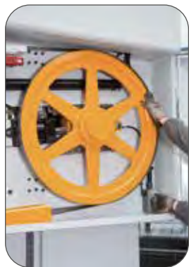
Changement de lame rapide