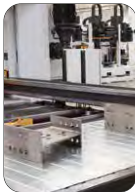
Dispositif de déchargement automatique par aimant

KATANA saws can be equipped with automatic: